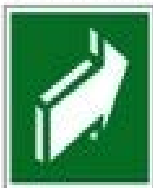
Открывать движением от себя