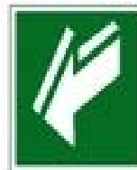
Открывать движением на себя