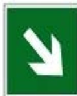
Направляющая стрелка под углом 45°