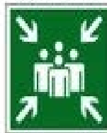
Пункт (место) сбора