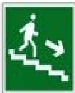
Направление к выходу по лестнице вниз