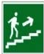
Направление к выходу по лестнице вверх