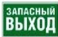
Указатель запасного выхода